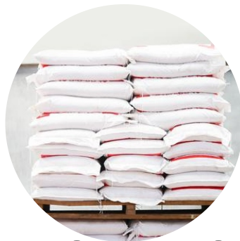
WORKI PO NAWOZACH