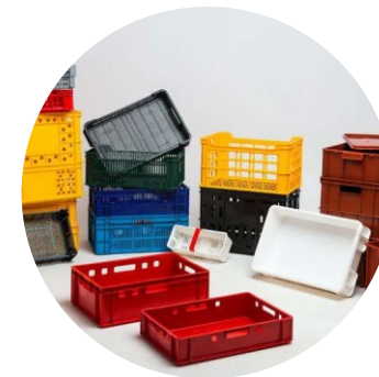
SKRZYNKI Z TWORZYW